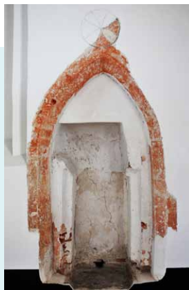
BIJ DE RESTAURATIE VAN DE KERK TERUGGEVONDEN PISCINA MET HIERBOVEN EEN FRAGMENT VAN EEN GESCHILDERD WIJDINGSKRUIS.

INTERIEUR De kerk moet ooit in steen overwelfd zijn geweest. Daarop wijzen de muurdikte en een spoor van een gewelfaanzet aan de noordzijde van de kansel. De gotische piscina met geschilderde omranding aan de zuidzijde in de koorluiting werd tijdens de restauratie midden jaren tachtig ontdekt. Boven de spitsboog van deze piscina kwam een wijdingskruis voor de dag. Ook kwamen er over de volle lengte van de zuid- en noord-muur geschakelde korfbogen aan het licht. De kansel is laat 18e-eeuws en heeft op de kuippanelen de symbolen van de vier jaargetijden: bloei voor de lente, korenaren voor de zomer, druiven voor de herfst en schaatsen voor de winter. De avondmaalstafel is in Lodewijk XVI-stijl. Hij werd in 1809 gemaakt door Lieuwe Hendriks Hemminga uit Beetsterzwaag. De herenbanken zijn 18e-eeuws, de rest van de banken dateert uit 1863.