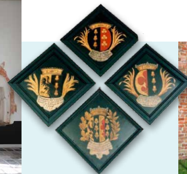
IN DE KERK HANGEN TWAALF RUITVORMIGE ROUWBORDEN, GEMAAKT VOOR LEDEN VAN DE FAMILIES VAN TEIJENS EN VAN FOCKENS. ZE KOMEN UIT DE KERK VAN BEETSTERZWAAG.