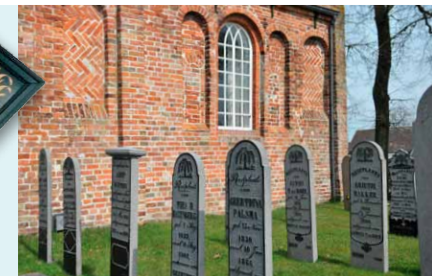
ZUIDGEVEL MET GRAFFALLEN VAN BELGISCH HARDSTEEN.