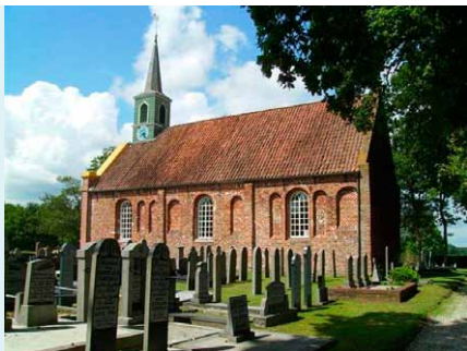
KERK GEZIEN VANUIT HET ZUIDEN.

Architect T. Glastra uit Marum bouwde in 1906 een nieuw portaal voor de kerk en gebruikte hiervoor waalsteen i.p.v. rode Groninger baksteen. Het portaal heeft evenals de gevel aan weerszijden pilasters, bekroond met smeedijzeren ornamenten. De klok dateert uit 1777 en werd gegoten door J. Borchard te Enkhuizen. Het eerste uurwerk werd in 1879 gemaakt door de instrumentmaker H. Deutgen uit Groningen. De in 1916 wegens bouwvalligheid nieuwgebouwde toren kreeg een uurwerk van de firma Weule uit Bockenem in het Hartzgebirge.