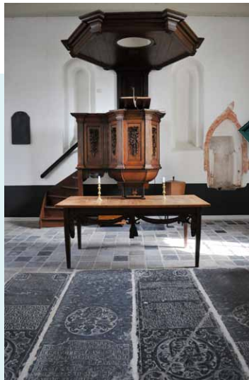
GEZICHT OP HET KOOR.