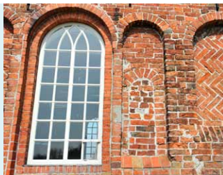
EEN VERGROOT VENSTER MET DAARNAAST IN EEN NIS EEN GEDICHT VENSTER. RECHTS EEN NIS MET SIERMETSELWERK.